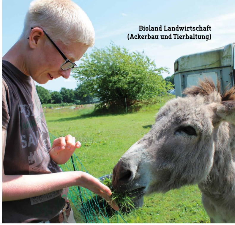
Bioland Landwirtschaft (Ackerbau und Tierhaltung)