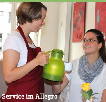
Service im Allegro